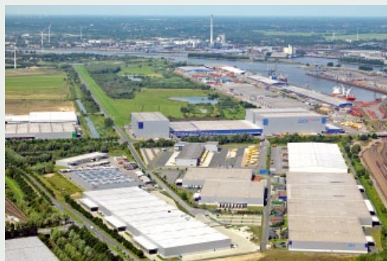
Sieger des Gewerbestandort-Rankings: das GVZ Bremen.

Auf den Rängen vier bis zehn finden sich weitere GVZ (Berlin Süd, 5.; Erfurt, 8.; Kassel, 10.) sowie die Logistik-Gewerbegebiete Hamburg Altenwerder (4.), Hamburg Billbrook (6.), Baunatal Linnfeld (7.) und