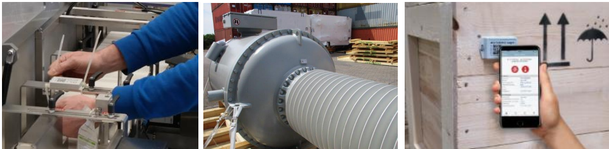
Kostengünstig und einfach im Handling sind die Schock- und Klimasensoren G-Log von ASPION.

Dieses finanzielle Investment kann sich als eine Hürde erweisen, weshalb sich der Aufwand rentieren muss. Der höhere Preis des Datenloggers gegenüber einem Indikator lässt sich mit Sicherheits- und Wertaspekten (Gefahrgut, teure Maschinen) rechtfertigen. Reeder und Spediteure überwachen mit GPS-gestützten Track-and-Trace-Systemen ihre Transportmittel und sind der Ansicht, ein Rekordereinsatz sei unnötig. Welchen Belastungen die transportierten Waren dabei ausgesetzt sind, können die Transportdienstleister mit ihren Track-and-Trace-Systemen jedoch nicht sagen.